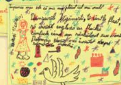
Impresii ale copiilor...